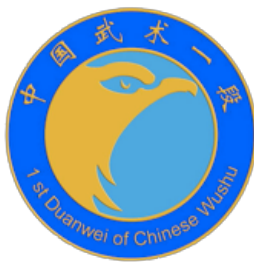
Logo Yi Duan