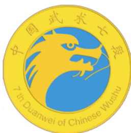
Logo Qi Duan